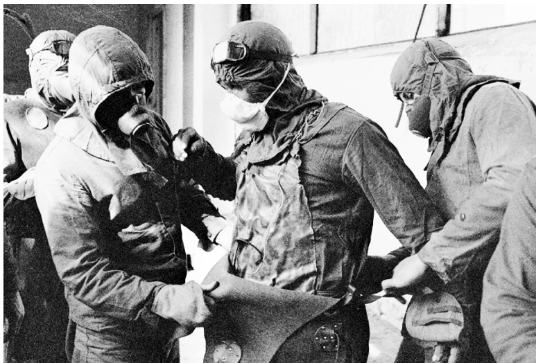
Люди, занимающиеся расчисткой кровли поврежденного реактора, одевают защитные костюмы.

1:23.38 Начальник смены 4-го энергоблока, поняв опасность ситуации, дал команду старшему инженеру управления реактором нажать кнопку аварийного глушения реактора АЗ-5. По сигналу этой кнопки в активную зону должны были вводиться стержни